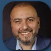
Expone Miguel Madrid Secretario Nacional UNAC